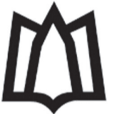
دانشگاه علوم پزشکی و

فرمانده انتظامی استان همدان در پایان با تقدیر از تلاش شبانه‌روزی مأموران پلیس آگاهی گفت: عدم رعایت نکات حفاظتی توسط صاحبان اموال، از عوامل مهم زمینه‌ساز وقوع چنین جرایمی است. وی بر استمرار برخورد قاطع با سارقان و اولویت‌جدی پلیس در حفظ امنیت عمومی تأکید کرد.