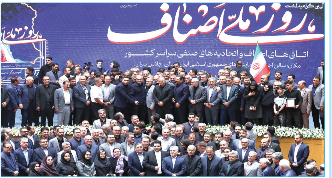
رئیس جمهور در مراسم روز ملی اصناف: گشایش‌های خوبی حاصل شده است

سخنگوی ستاد وداع، تدفین و تشییع رهبر شهید انقلاب: به درخواست مکرر مردم عراق تشییع پیکر رهبر شهید انقلاب چهارشنبه ۱۷ تیر در شهرهای نجف و کربلا انجام می‌شود