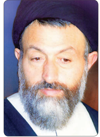
ظرفیت‌های آیت‌الله شهید بهشتی

خدمت به مردم و قدردانی عملی از صبر و مقاومت آنان، زمینه‌ساز افزایش همبستگی ملی و پیشرفت کشور خواهد بود